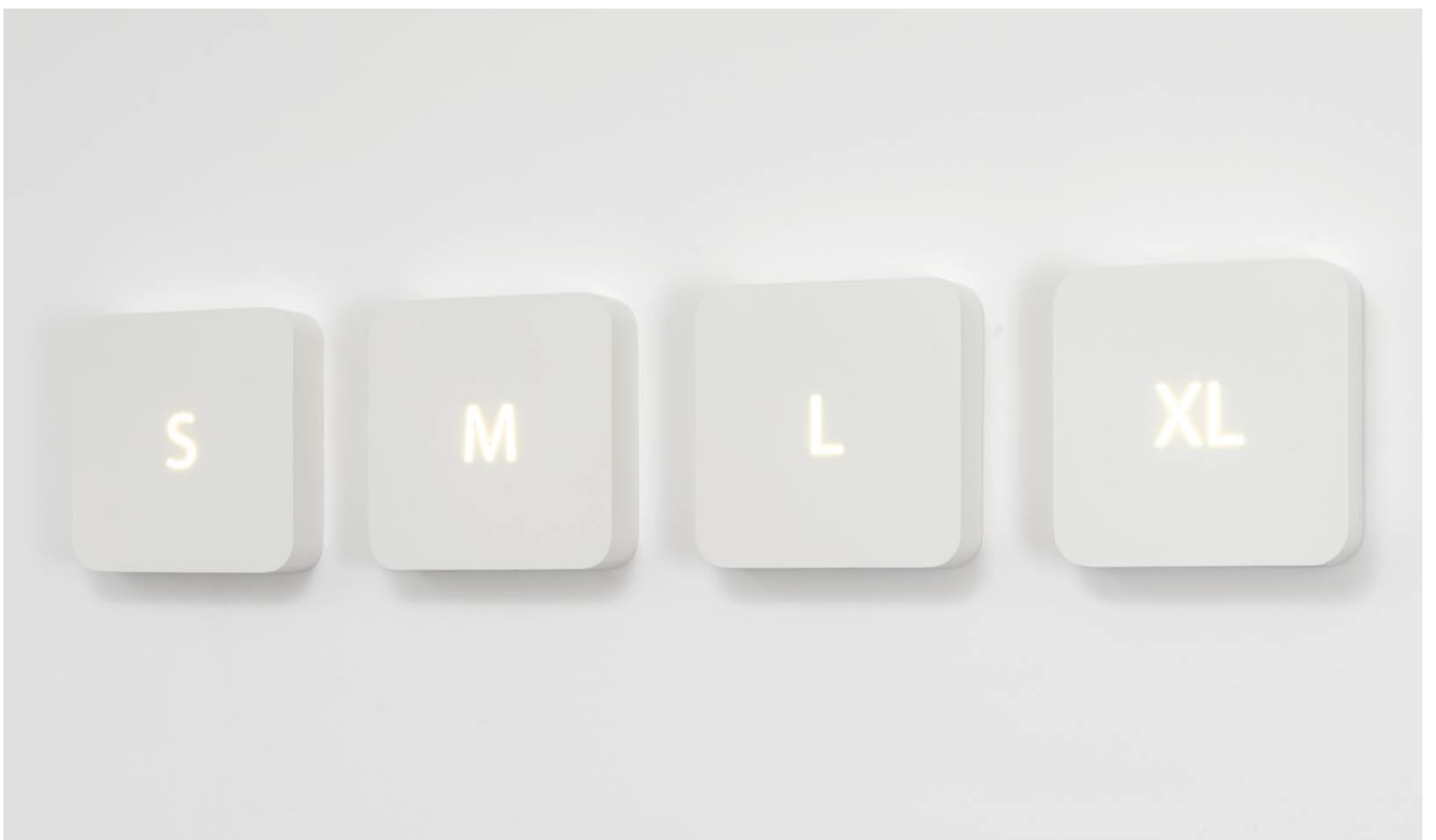
S M L XL | 2010 | VIER LEUCHTKÄSTEN, PULVERBESCHICHTETER STAHL, ACRYLGLAS | je 45 x 45 x 10 cm