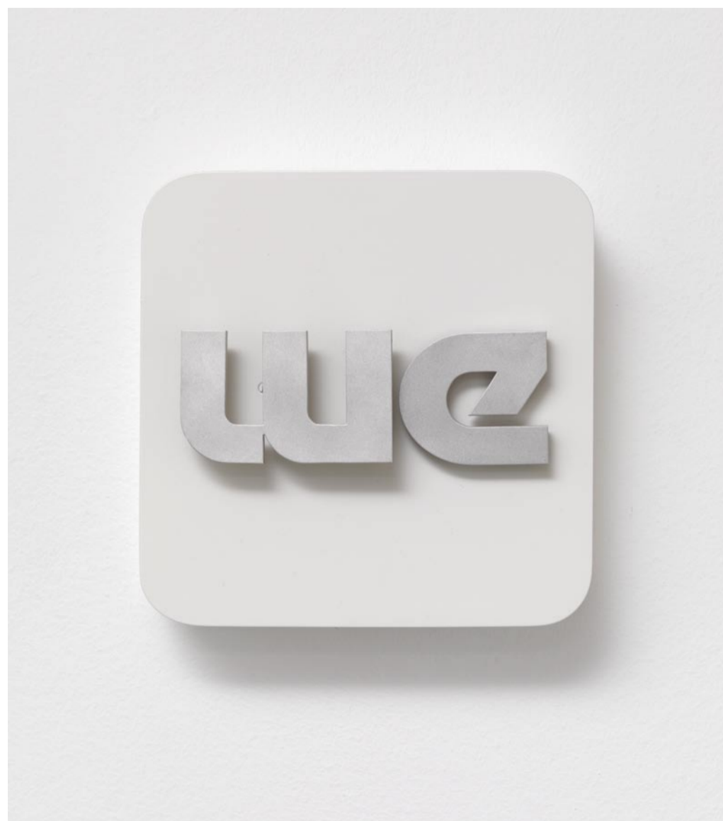
ME - WE | 2010 | PULVERBESCHICHTETER STAHLKASTEN, ALUMINIUM, MOTOR | 20 x 20 x 7 cm