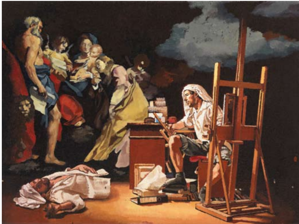
ATELIER II | 2008 | Öl auf Leinwand | 30 x 40 cm oil on canvas | 11.8 x 15.8 inches