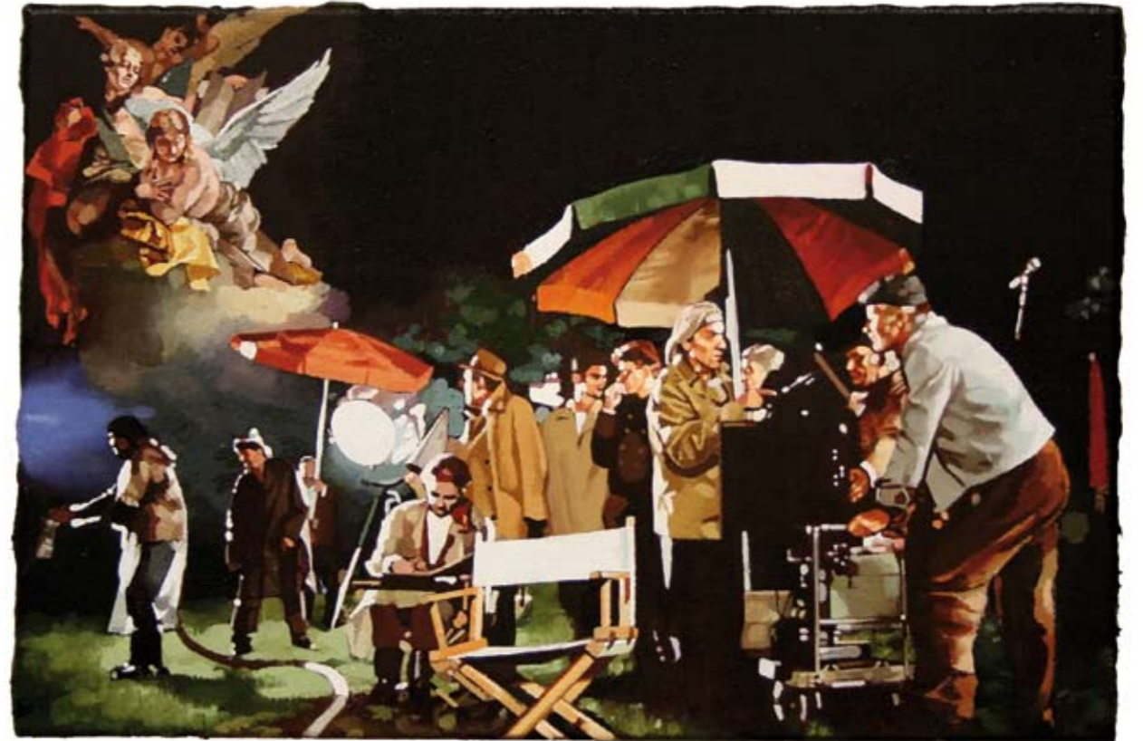
DIE EWIGEN KOMPARENEN | 2007 | Öl auf Leinwand | 40 x 60 cm oil on canvas | 15.8 x 23.6 inches