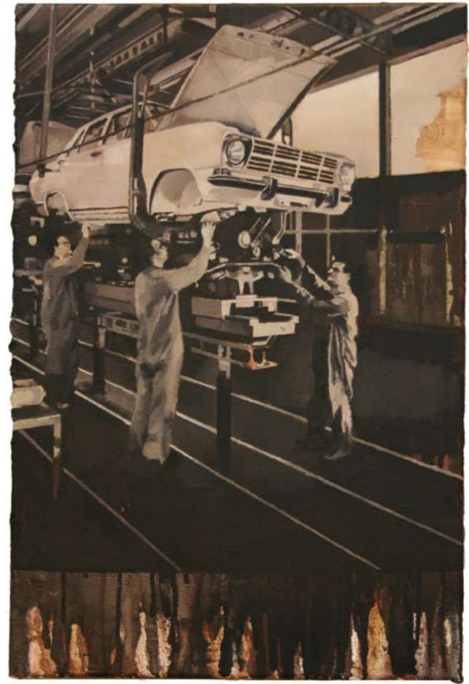
OPEL | 2006 | Öl auf Leinwand | 60 x 40 cm oil on canvas | 23.6 x 15.8 inches