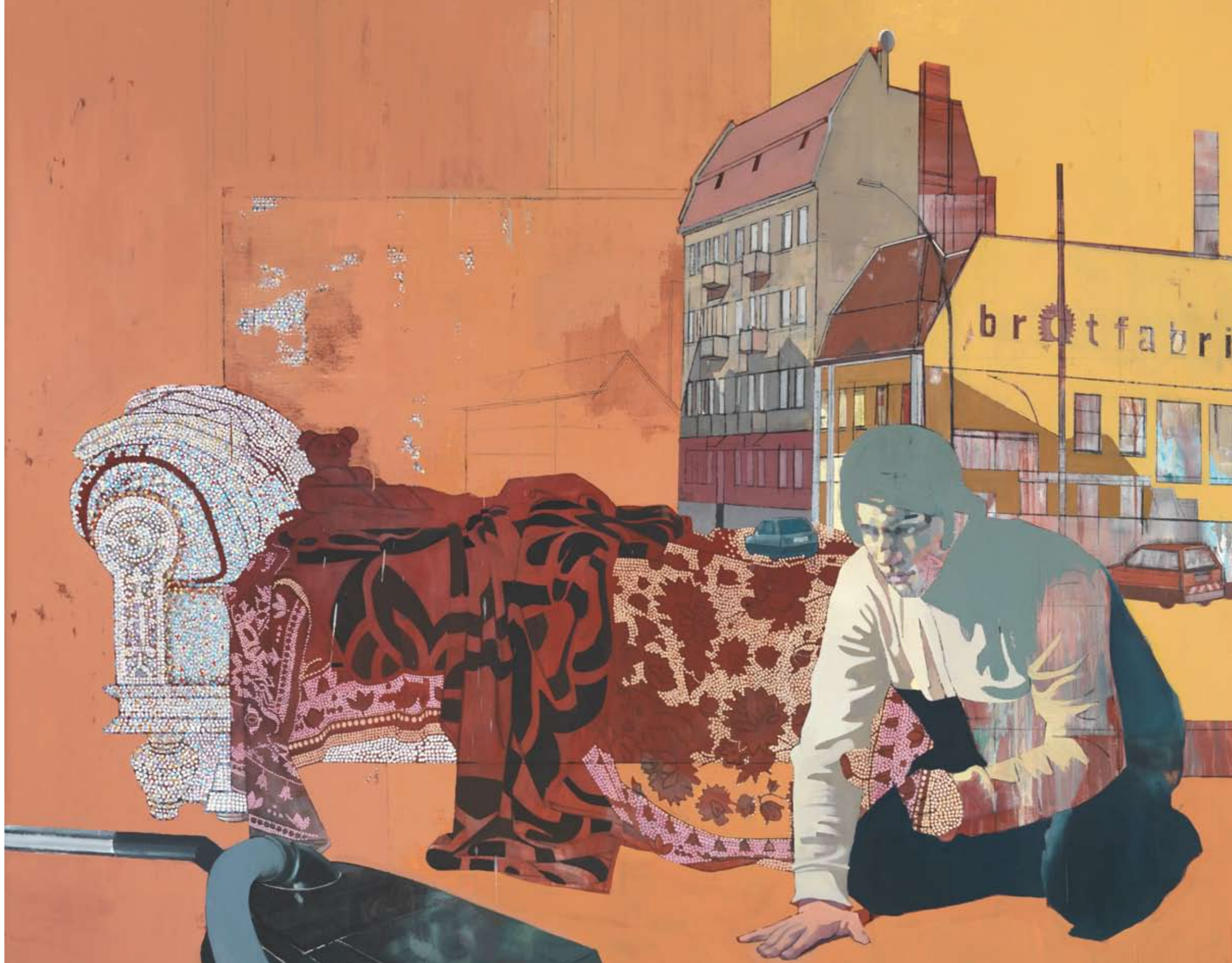
NARZISS I | 2005 | Öl auf Leinwand | 200 x 250 cm oil on canvas | 78.5 x 98.4 inches