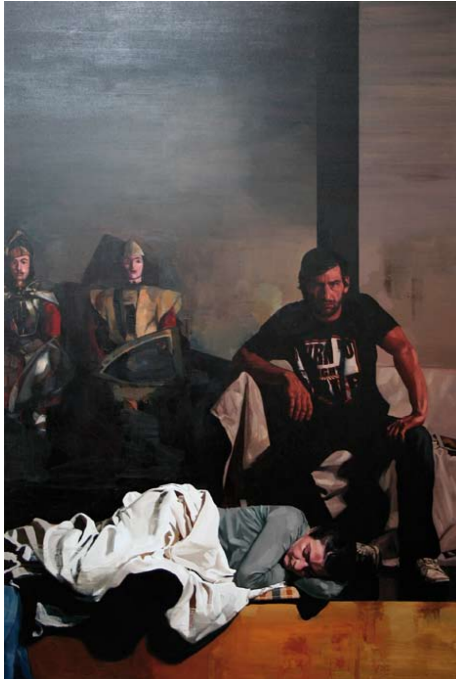
MARIONETTEN | 2009 | Öl auf Leinwand | 240 x 160 cm oil on canvas | 94.5 x 63 inches