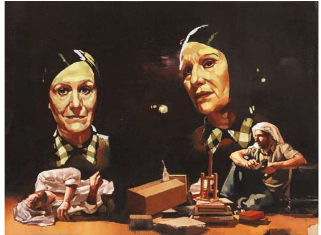
DIE DAMEN | 2008 | Öl auf Leinwand | 30 x 40 cm oil on canvas | 11.8 x 15.8 inches