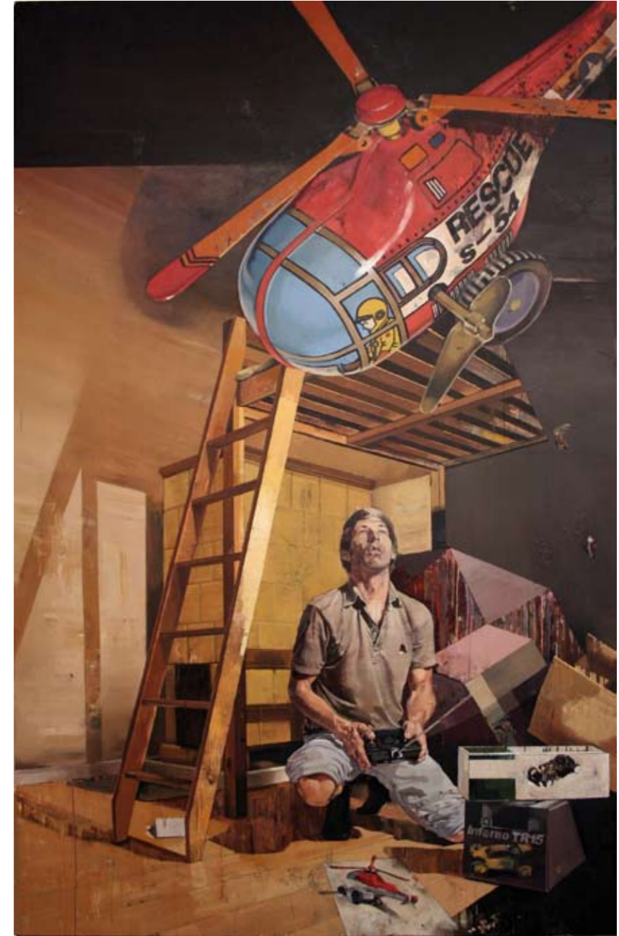
INFERNO | 2006 | Öl auf Leinwand | 250 x 160 cm oil on canvas | 98.4 x 63 inches