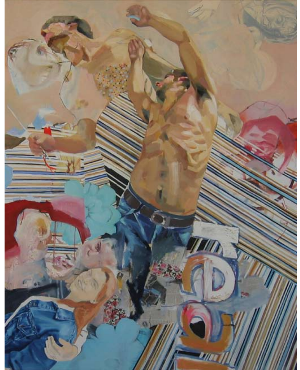
REAL II | 2004 | Öl auf Leinwand | 200 x 160 cm oil on canvas | 78.75 x 63 inches