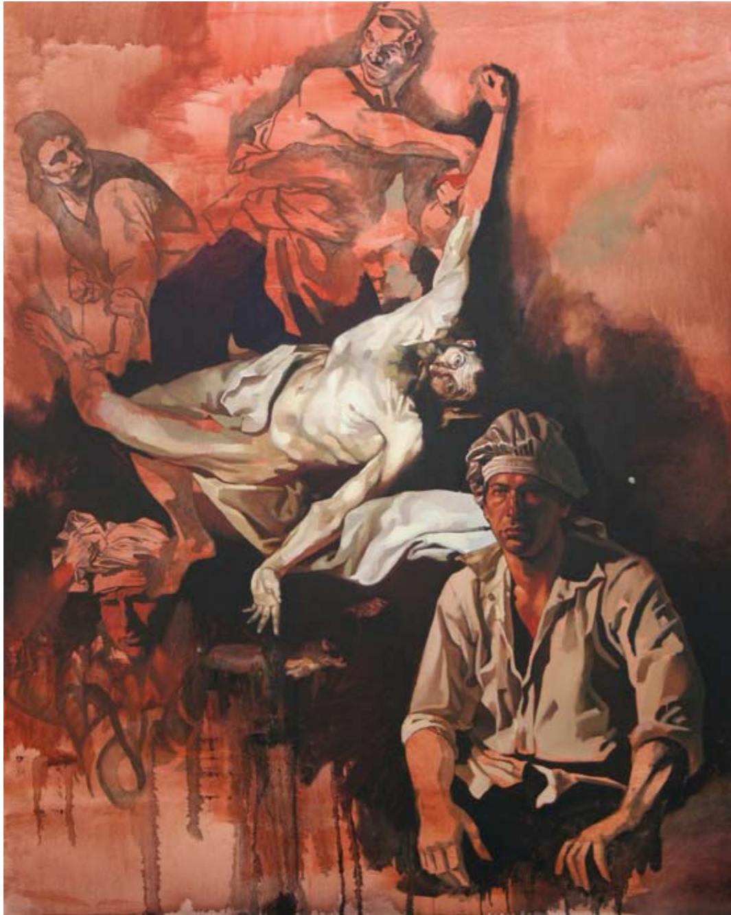
DIE NACHT I | 2008 | Öl auf Leinwand | 150 x 120 cm oil on canvas | 59 x 47.3 inches