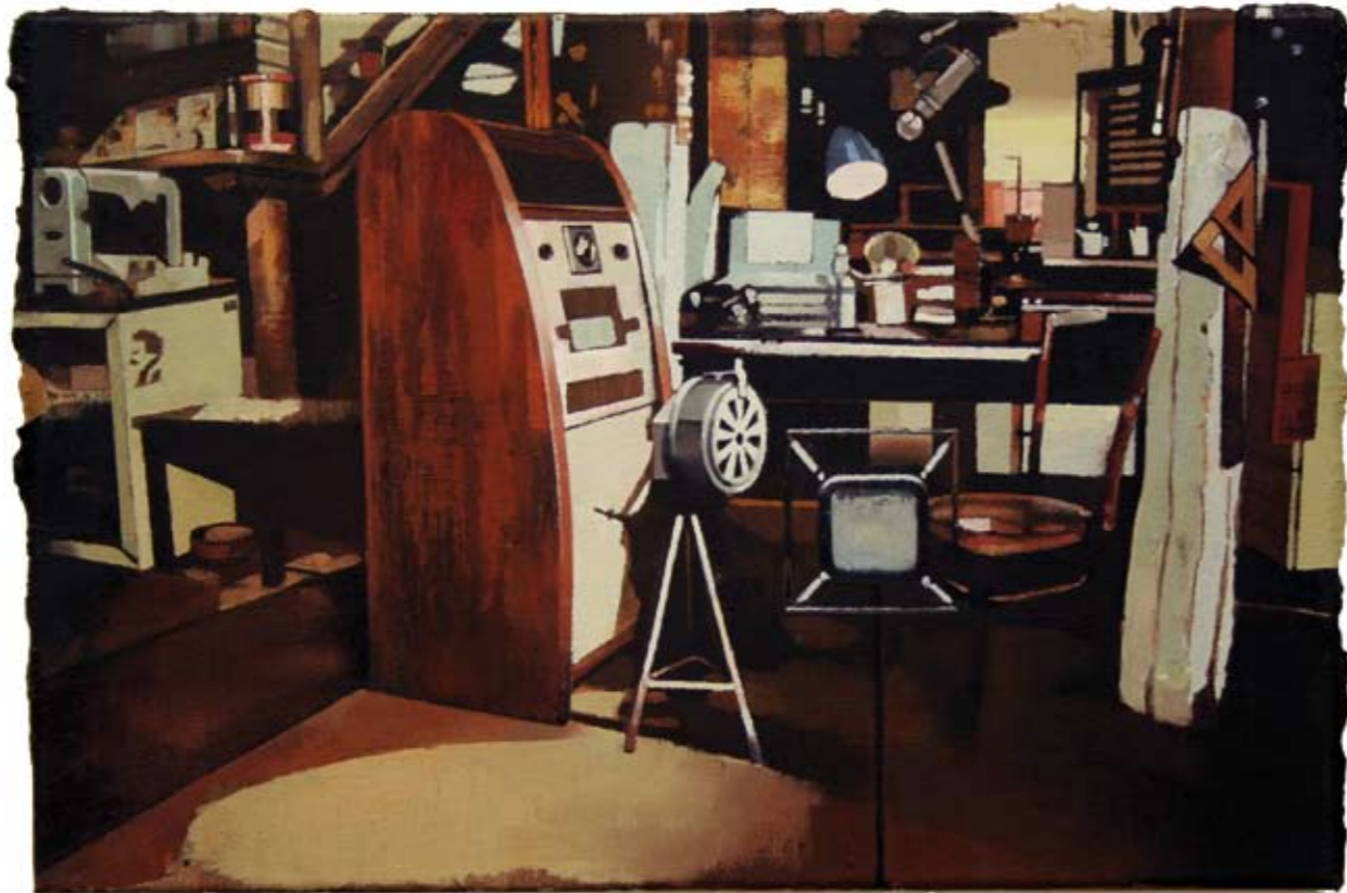
KAMMER I | 2006 | Öl auf Leinwand | 40 x 60 cm oil on canvas | 15.8 x 23.6 inches