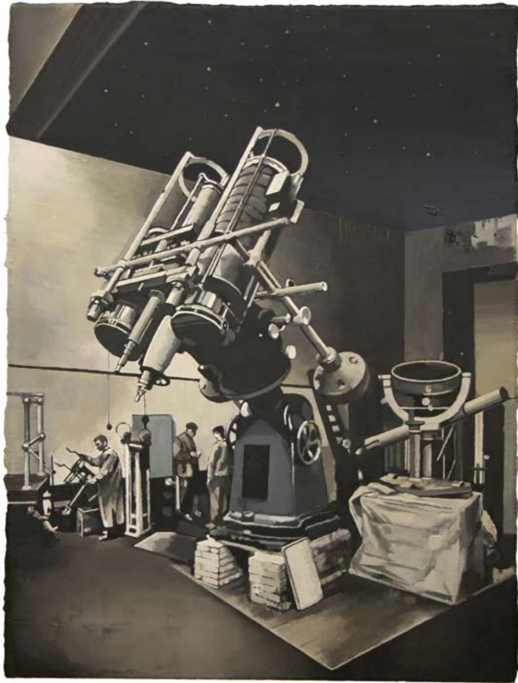
STERNWARTE | 2007 | Öl auf Leinwand | 80 x 60 cm oil on canvas | 31.5 x 23.6 inches