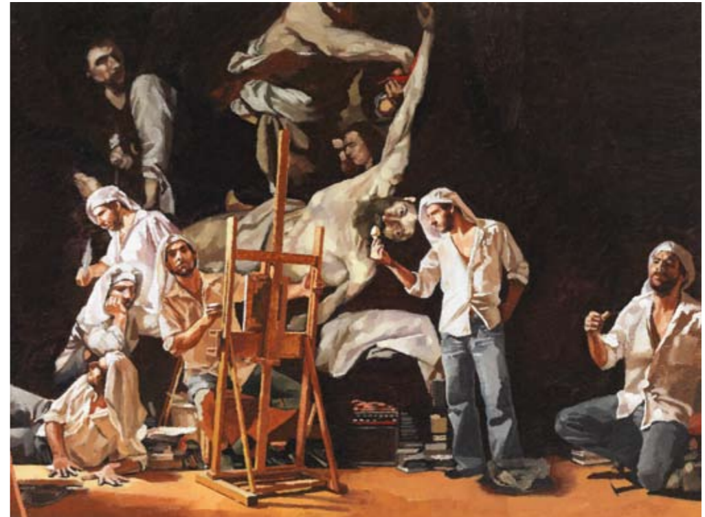
DIE NACHT II | 2008 | Öl auf Leinwand | 30 x 40 cm oil on canvas | 11.8 x 15.8 inches