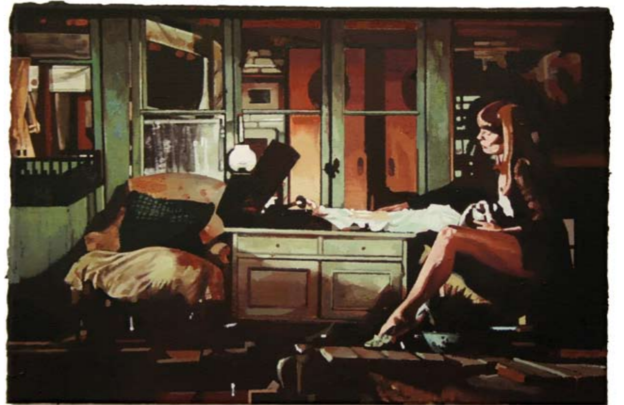
KAMMER II | 2007 | Öl auf Leinwand | 40 x 60 cm oil on canvas | 15.8 x 23.6 inches