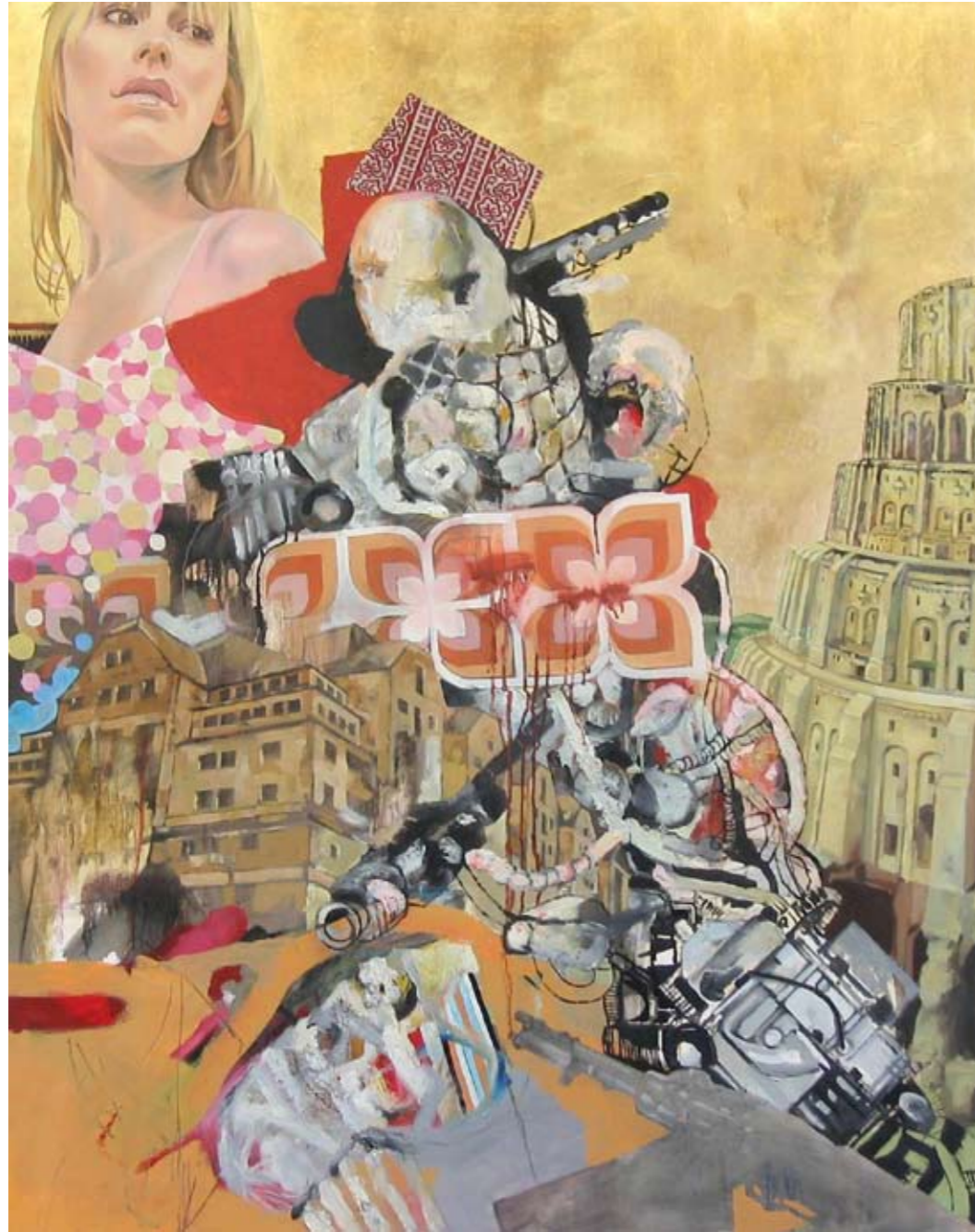
TÜRME | 2004 | Öl auf Leinwand | 150 x 120 cm oil on canvas | 59.1 x 47.3 inches