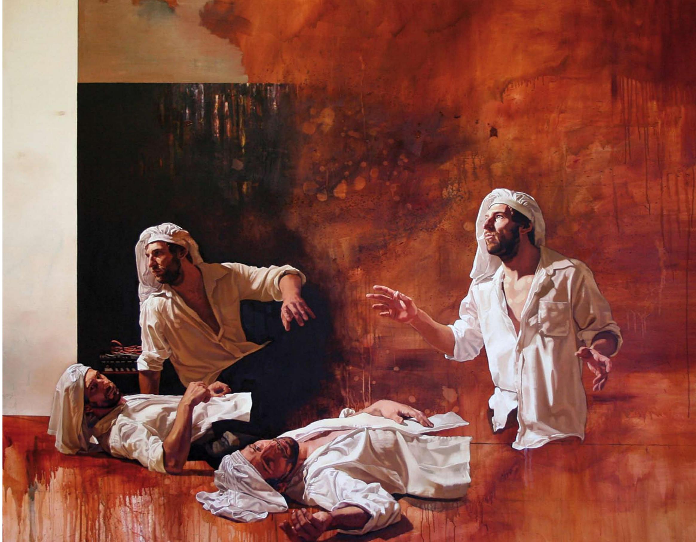
BAJAZZO | 2007 | Öl auf Leinwand | 200 x 250 cm oil on canvas | 78.8 x 98.4 inches