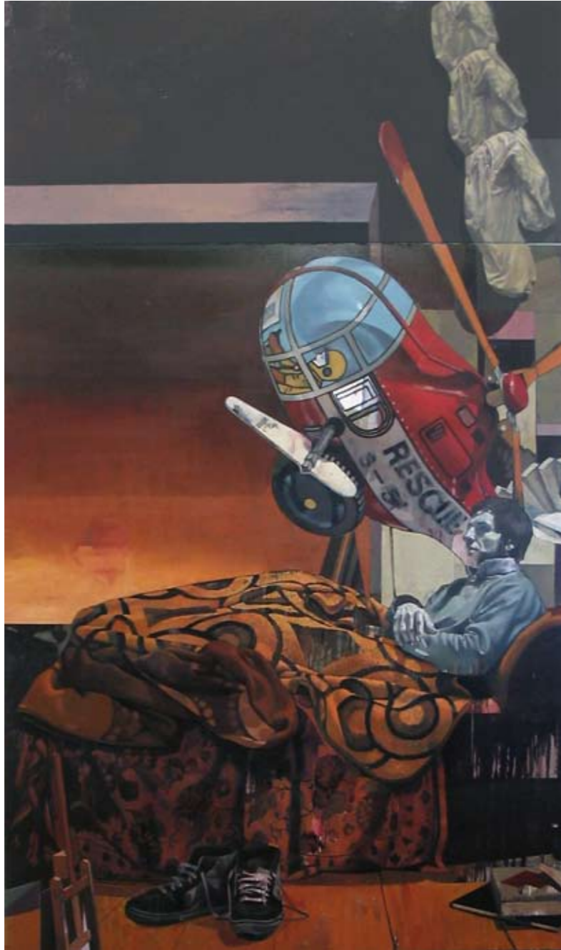
HARMONIE | 2006 | Öl auf Leinwand | 270 x 160 cm oil on canvas | 106 x 63 inches