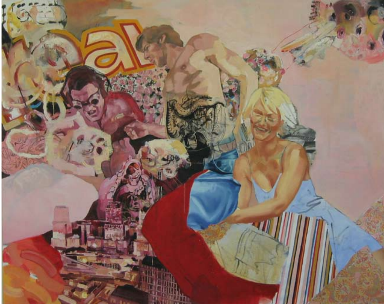
REAL III | 2004 | Öl auf Leinwand | 160 x 200 cm oil on canvas | 63 x 78.8 inches