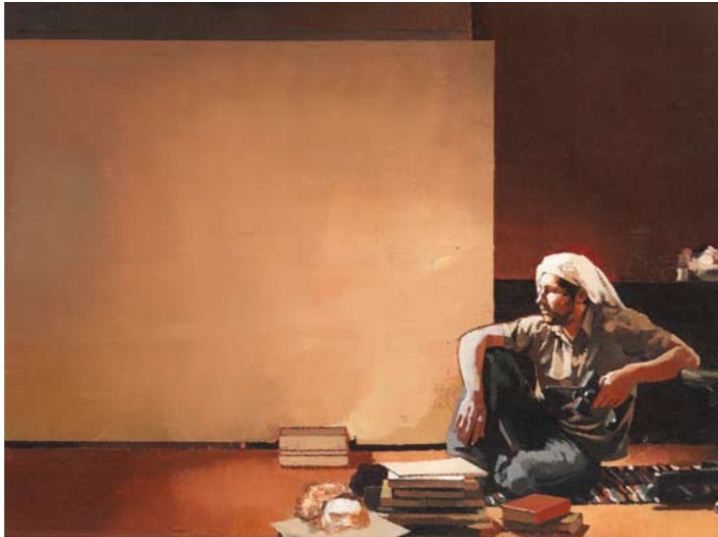
ATELIER I | 2008 | Öl auf Leinwand | 30 x 40 cm oil on canvas | 11.8 x 15.8 inches