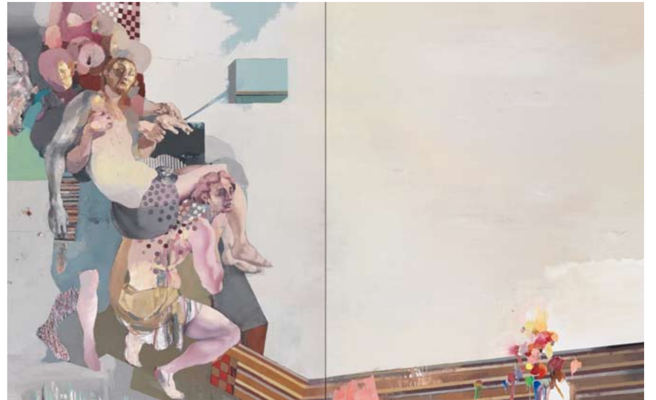
GRABLEGUNG | 2005 | Öl auf Leinwand | 200 x 320 cm | (Diptychon) oil on canvas | 78.5 x 126 inches | (diptych)