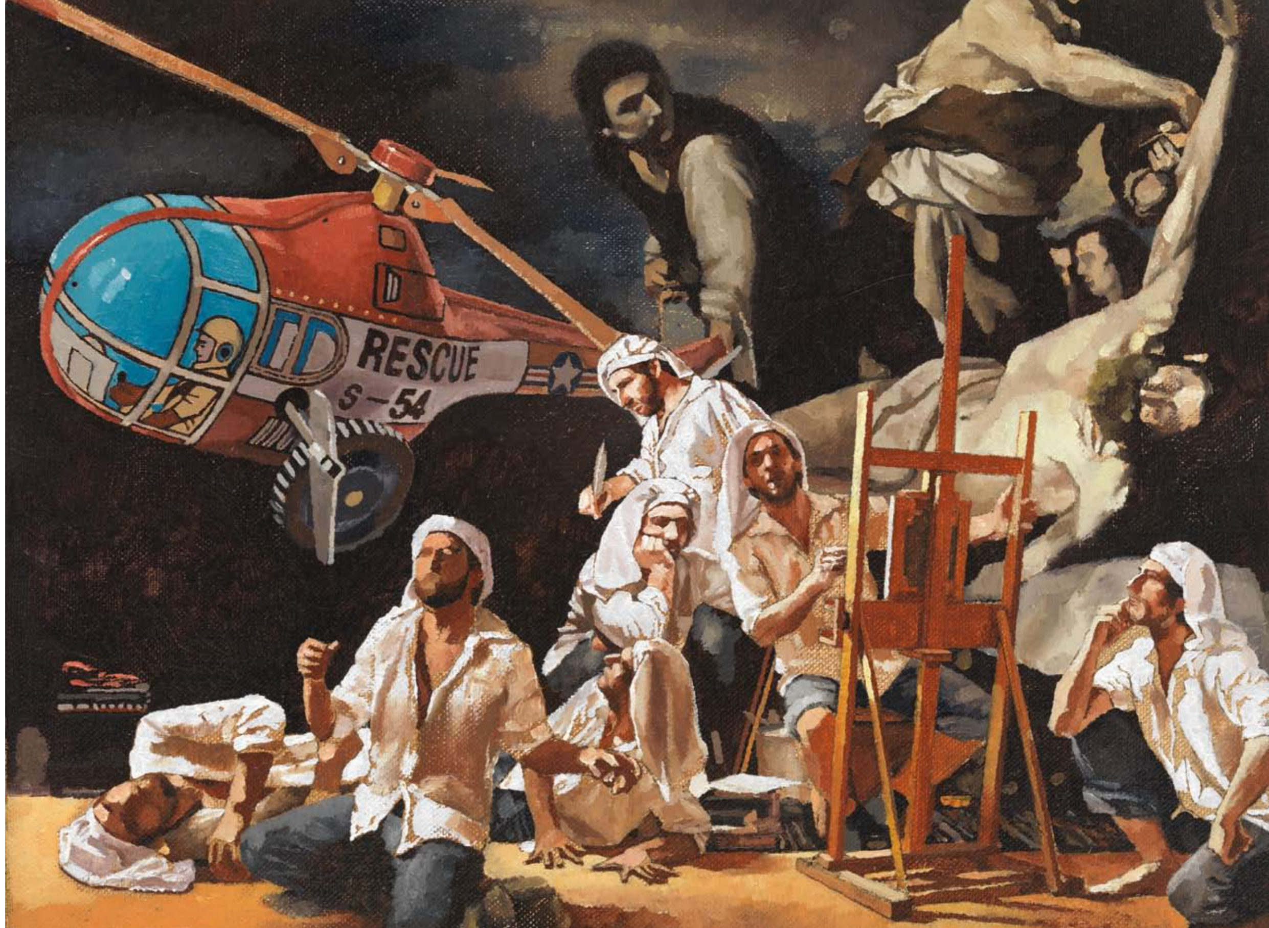
DIE NACHT III | 2008 | Öl auf Leinwand | 30 x 40 cm oil on canvas | 11.8 x 15.8 inches