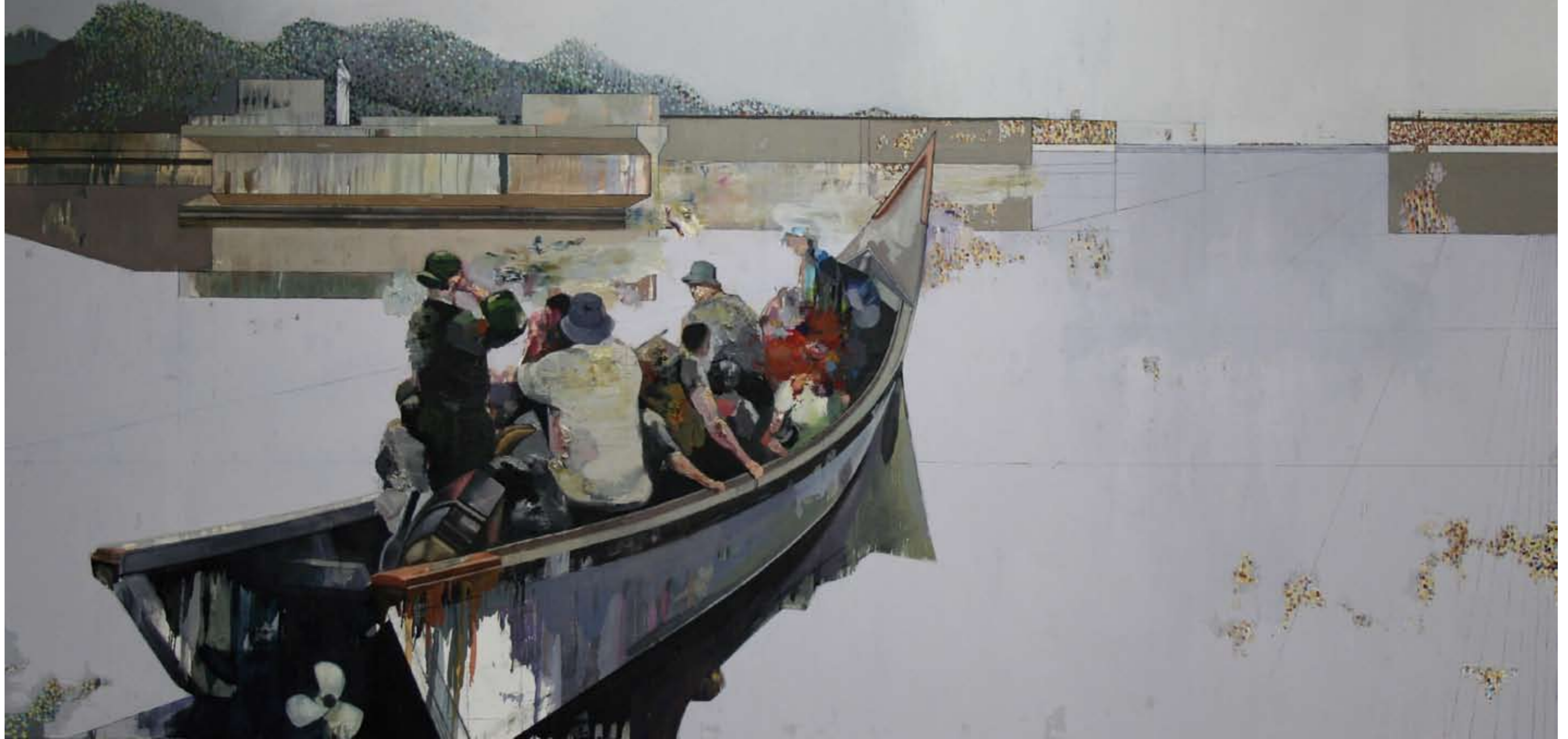
DIE REISE | 2005 | Öl auf Leinwand | 145 x 300 cm oil on canvas | 57.1 x 118.1 inches