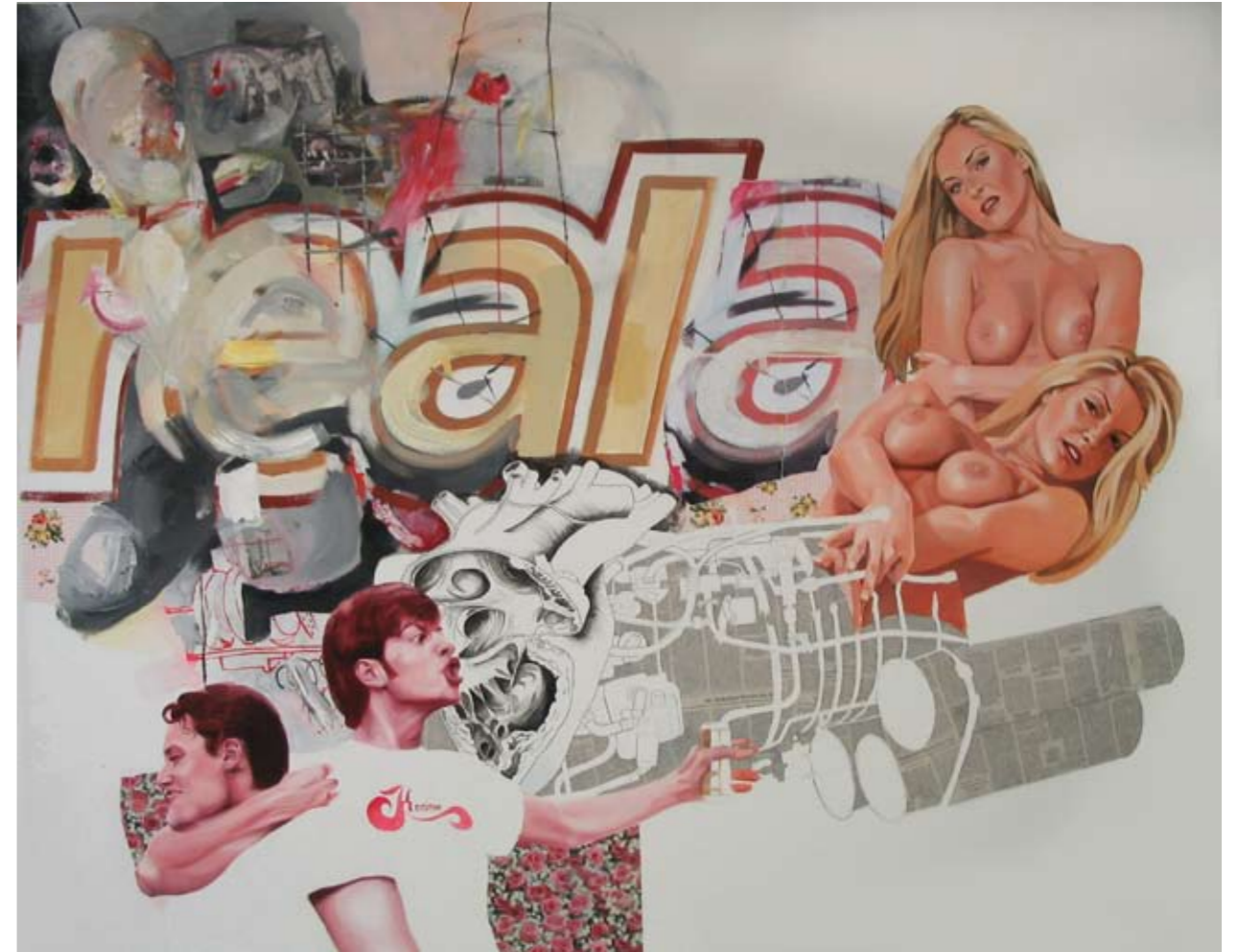
REALI | 2004 | Öl auf Leinwand | 160 x 200 cm oil on canvas | 63 x 78.75 inches