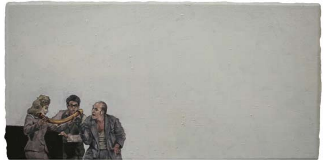
EXPERTEN | 2007 | Öl auf Leinwand | 30 x 60 cm oil on canvas | 11.8 x 23.6 inches