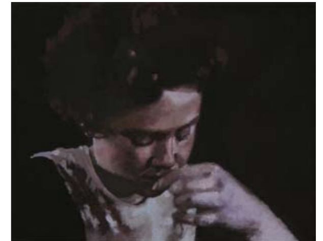
MÄDCHEN | 2007 | Öl auf Leinwand | 24 x 30 cm | (3-teilig) oil on canvas | 9.5 x 11.8 inches | (3 pieces)