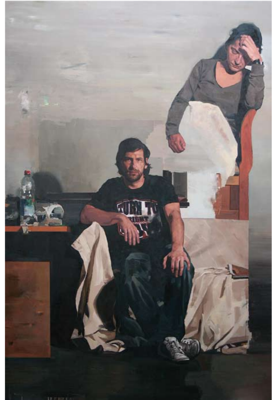
NACHMITTAG | 2009 | Öl auf Leinwand | 240 x 160 cm oil on canvas | 94.5 x 63 inches