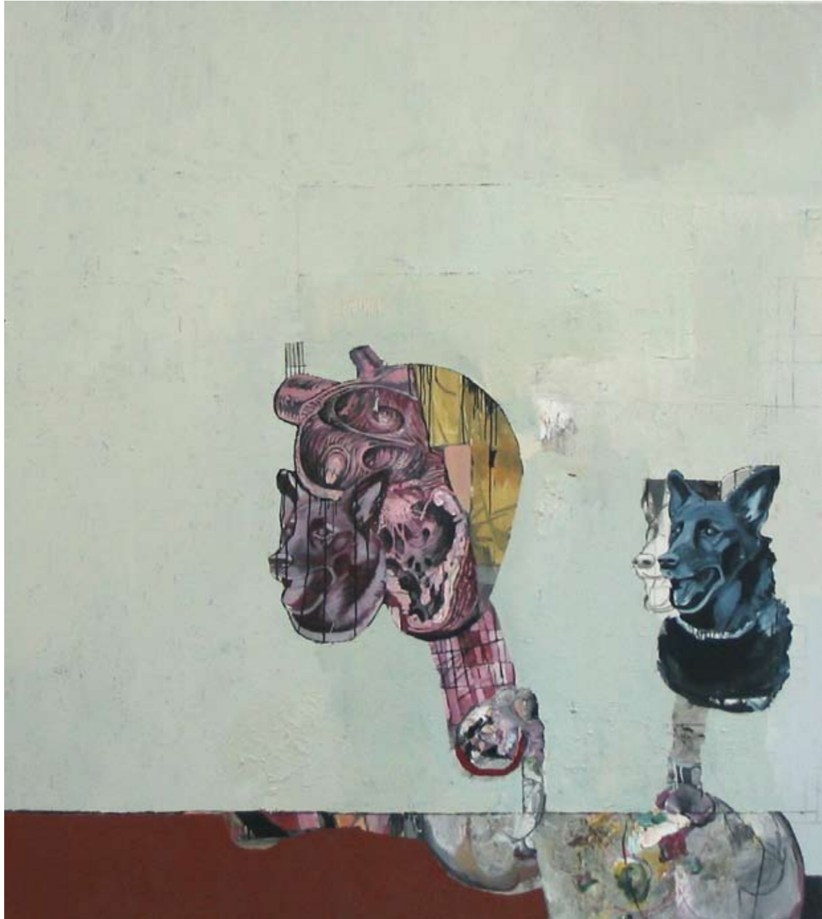
HUNDEHERZ | 2005 | Öl auf Leinwand | 200 x 180 cm oil on canvas | 78.5 x 70.9 inches