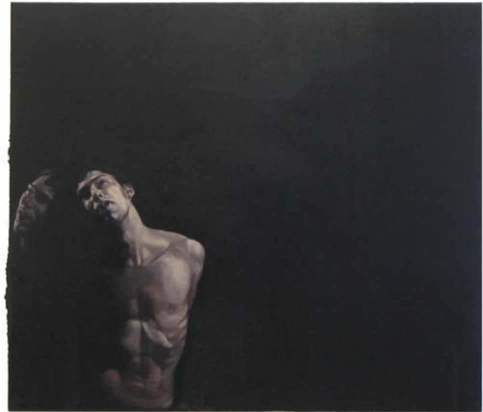
SPIEGELUNG | 2006 | Öl auf Leinwand | 130 x 150 cm oil on canvas | 51.2 x 59 inches