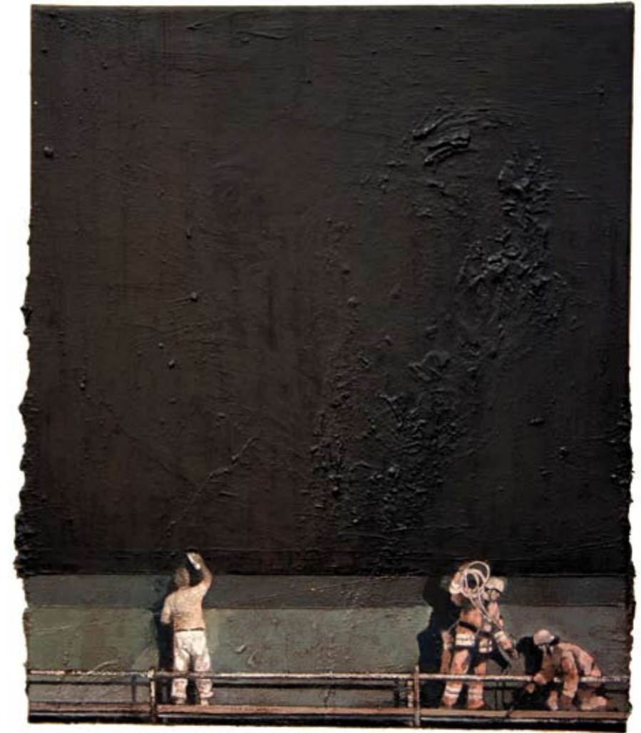
GERÜST | 2006 | Öl auf Leinwand | 60 x 50 cm oil on canvas | 23.6 x 19.8 inches