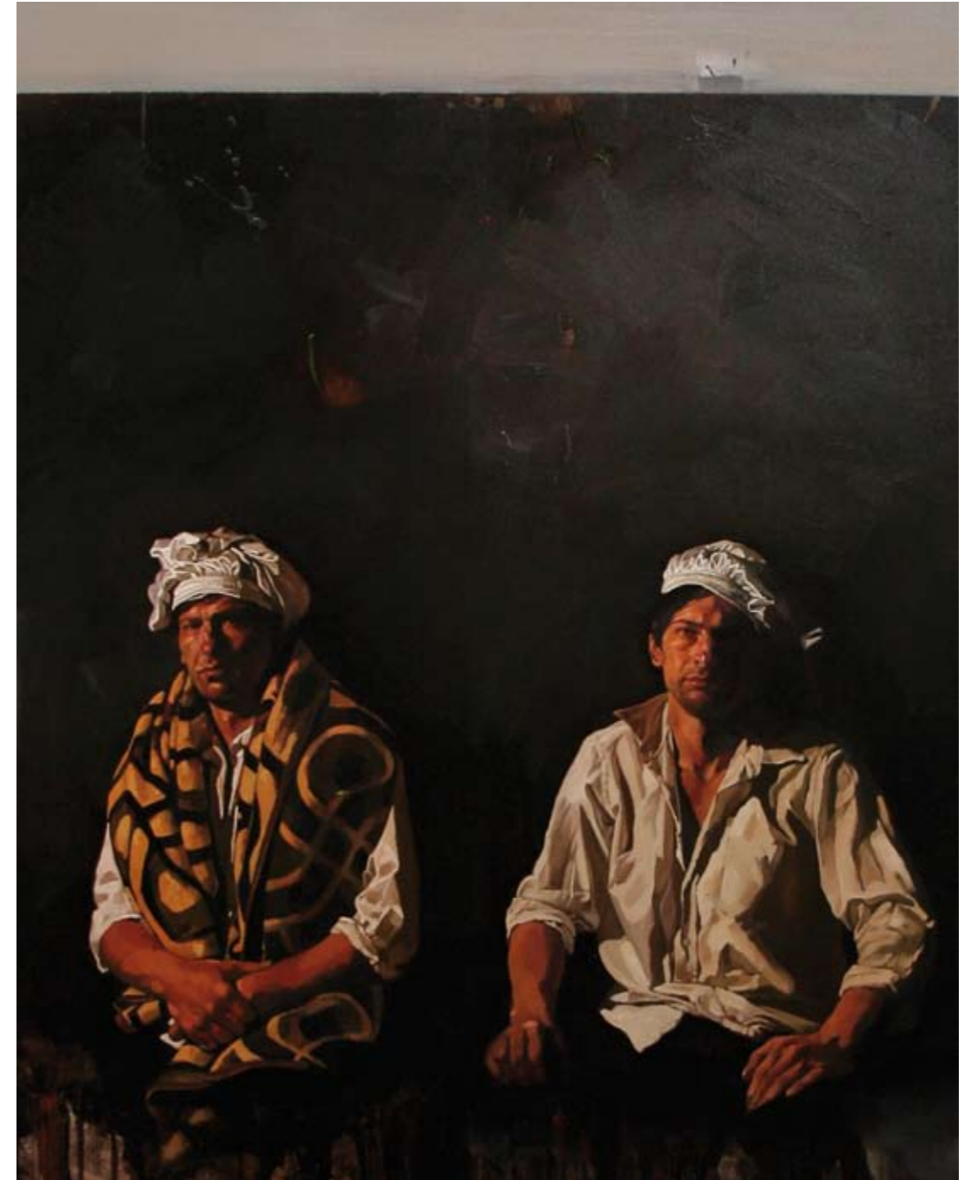
WARTEN | 2008 | Öl auf Leinwand | 150 x 120 cm oil on canvas | 59 x 47.3 inches