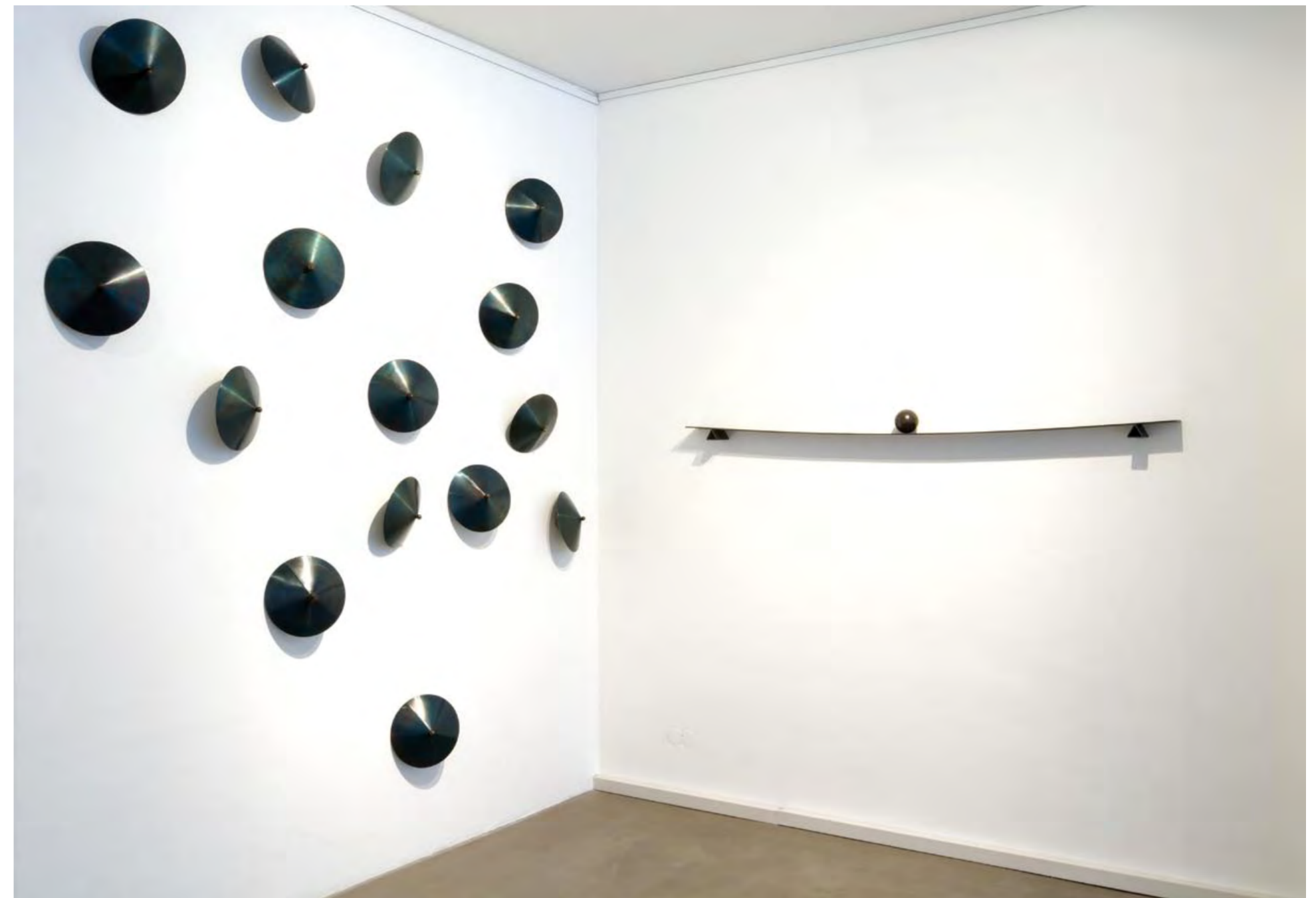
AUSSTELLUNGSANSICHT: 15 TOUPIES | 2010 | WEICHER STAHL, 15 TEILE | je 20 x 20 cm – HORIZON | 2010 | BRONZE, STAHL | 200 x 10 x 10 cm