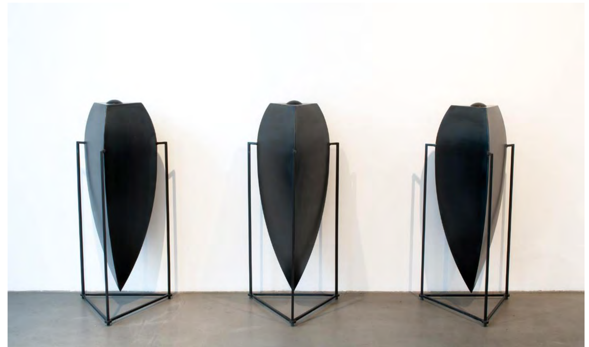
L'AGE DE FER. TAM TAM | 2010 | WEICHER STAHL | je 132 x 62 x 52 cm