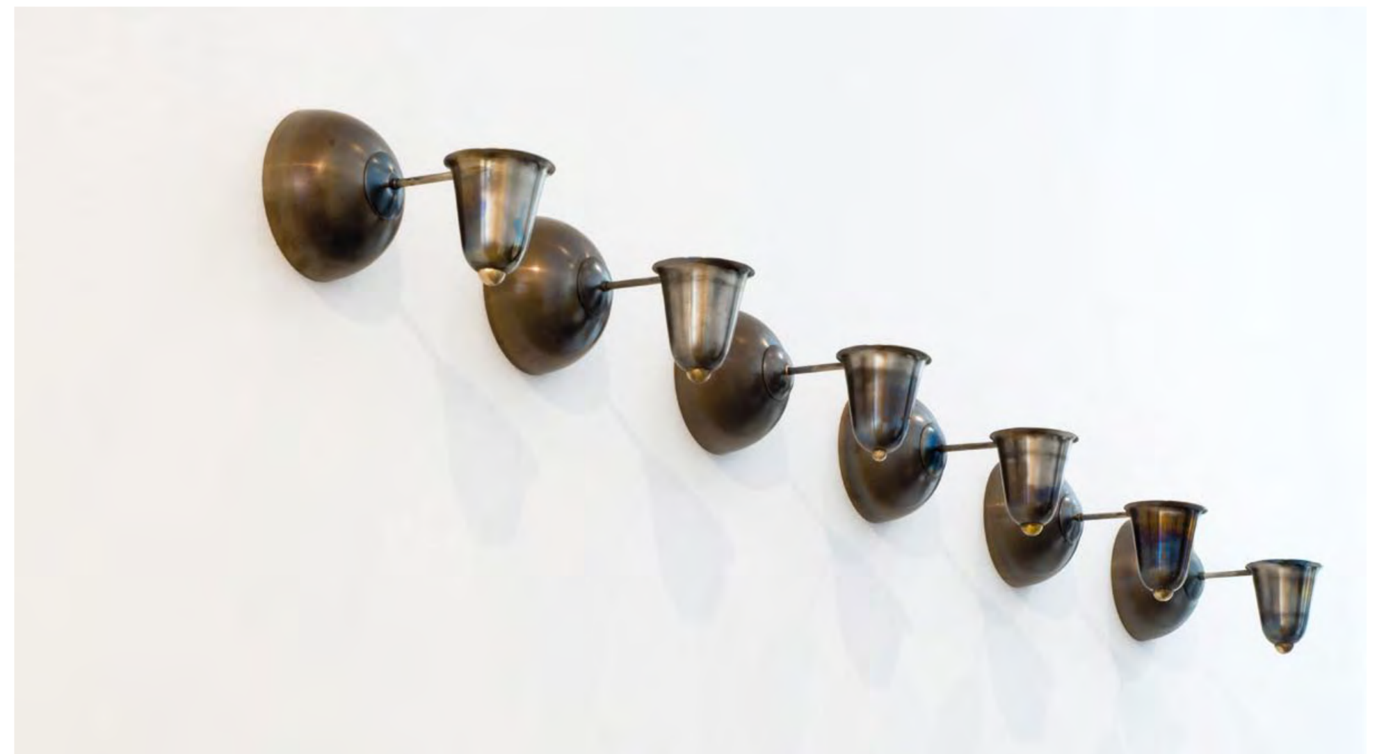
FONTAINES | 2010 | EDELSTAHL, 6 TEILE | je 12 x 12 x 20 cm