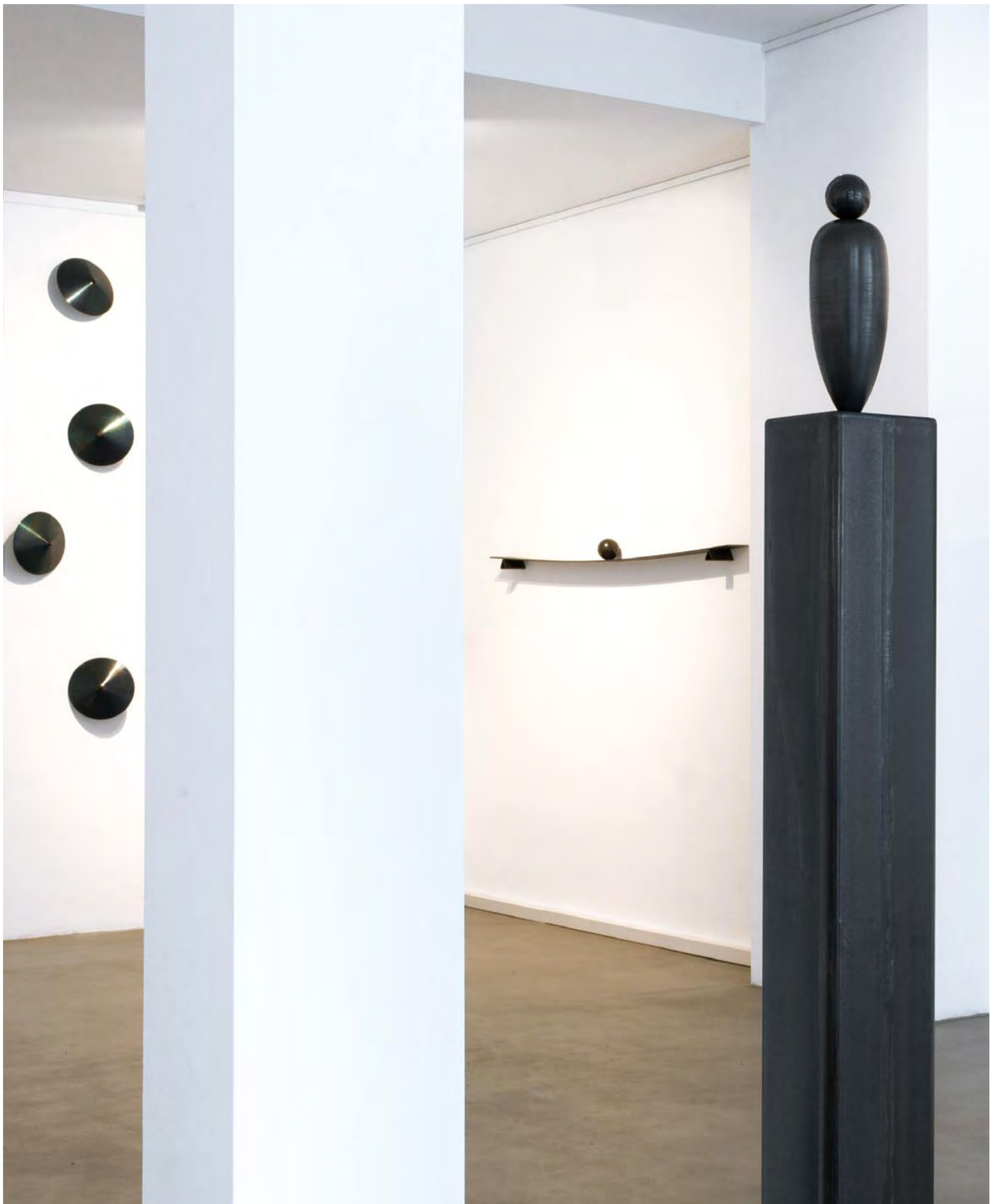
AUSSTELLUNGSANSICHT: 15 TOUPIES, HORIZON, SOLO.