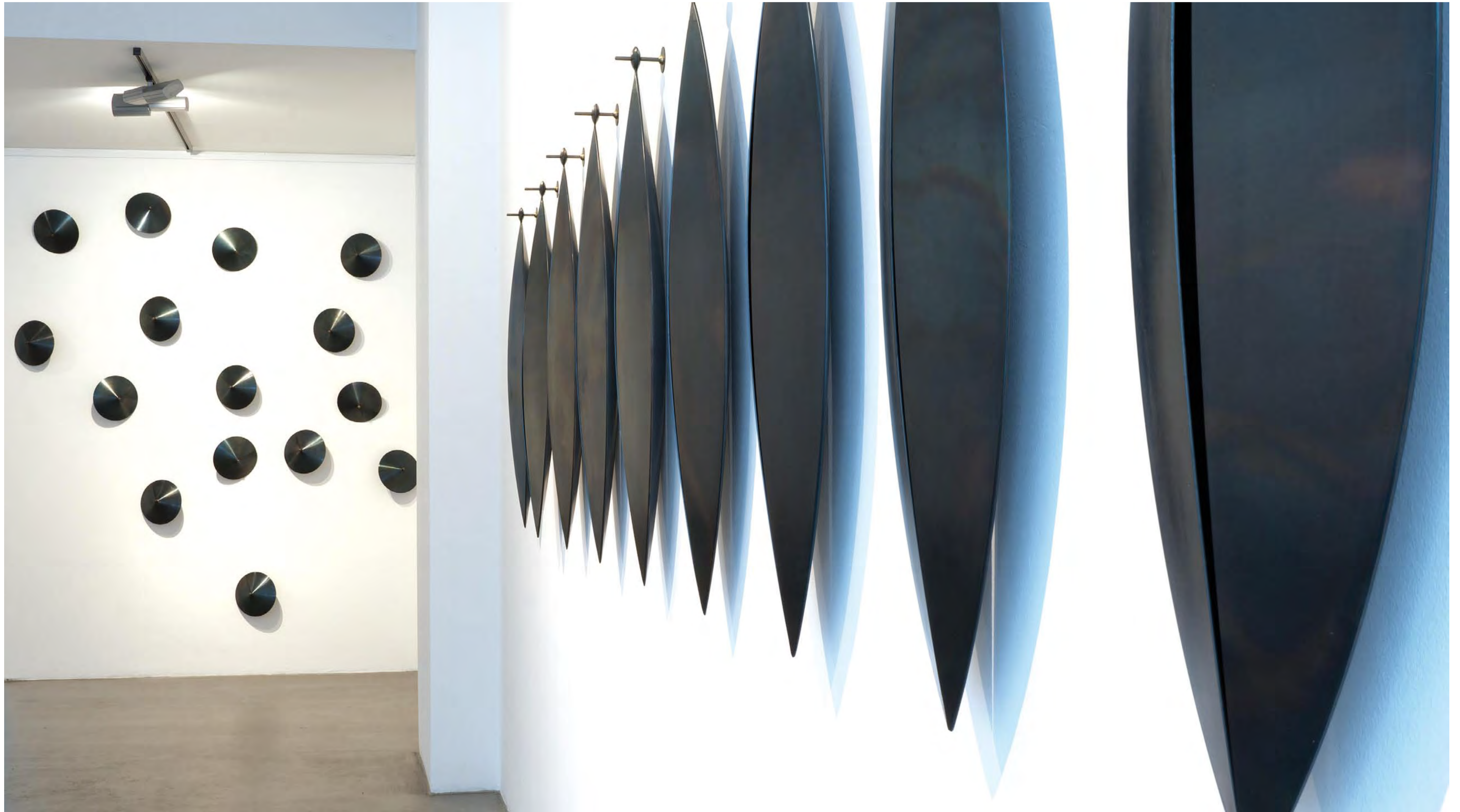
AUSSTELLUNGSANSICHT: 15 TOUPIES | 2010 | WEICHER STAHL, 15 TEILE | je 20 x 20 cm – 9 LARMES | 2010 | WEICHER STAHL, 9 TEILE | je 105 x 38 x 10 cm