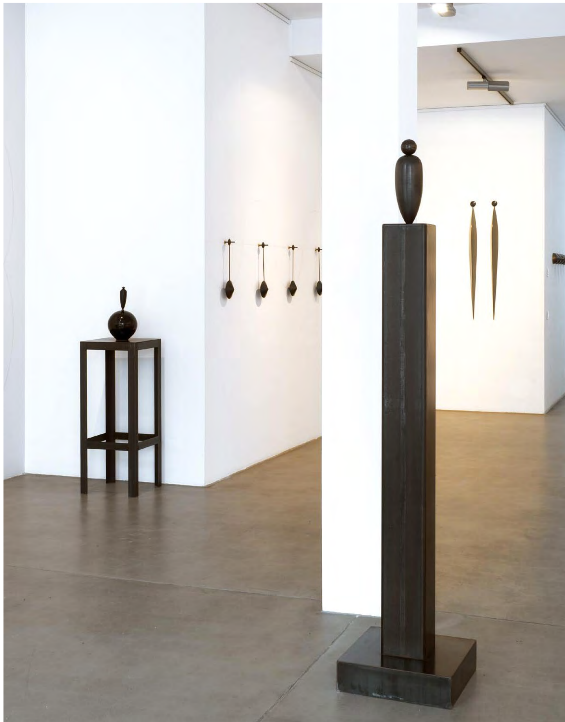
AUSSTELLUNGSANSICHT MIT IDÉE FIXE, DESSINER L'HORIZON, SOLO, AFRICA AFRICA.