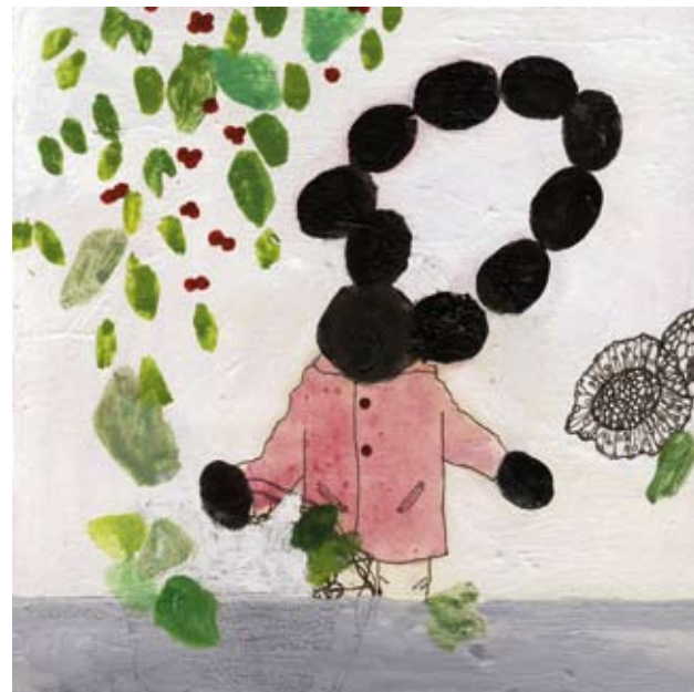
OHNE TITEL | 2008