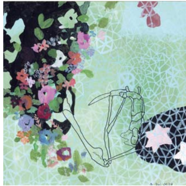
OHNE TITEL | 2007