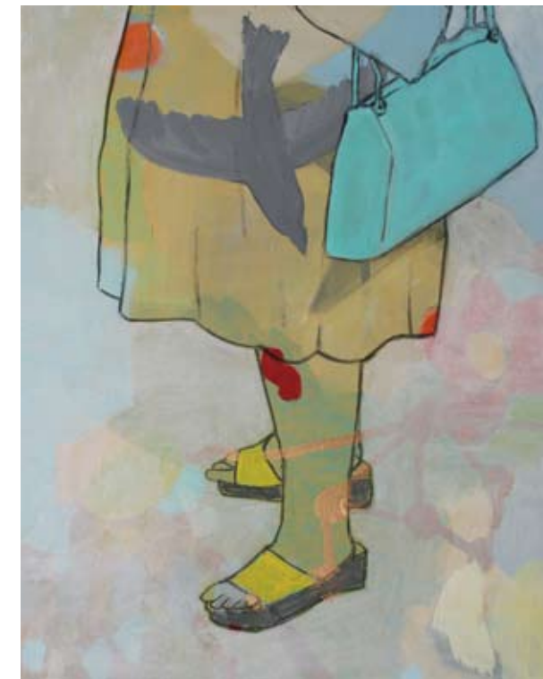
FRAU (MIT GELBEN SCHUHEN) | 2009 | Acryl und Kohle auf Leinwand | 50 x 40 cm acrylic and charcoal on canvas | 19.7 x 15.8 in