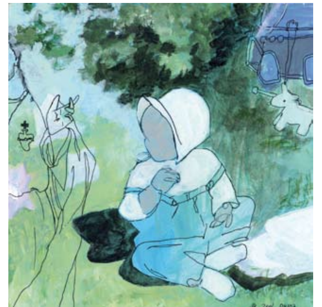
OHNE TITEL | 2007