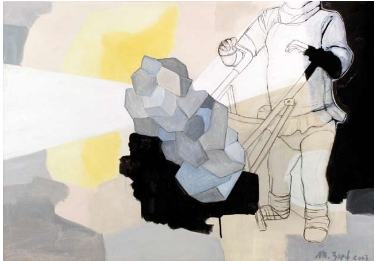
MÄDCHEN (EMMA) | 2007 | Acryl und Kohle auf Leinwand | 70 x 100 cm acrylic and charcoal on canvas | 27.6 x 39.4 in