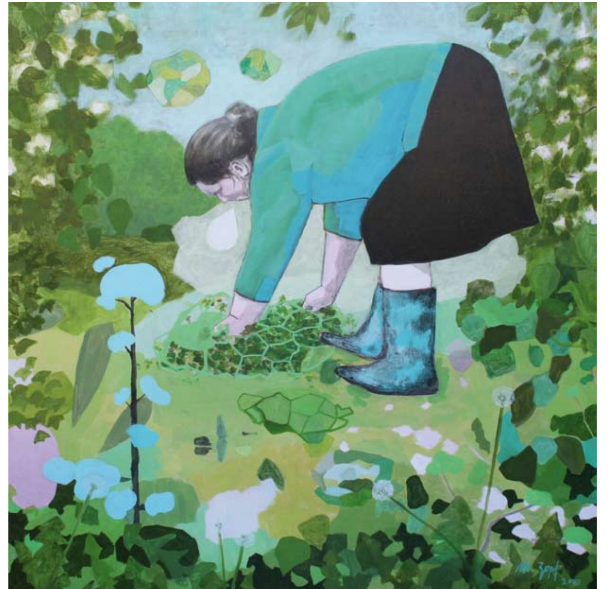
FRAU (IM GARTEN) | 2009 | Acryl und Kohle auf Leinwand | 100 x 100 cm acrylic and charcoal on canvas | 164 x 164 in