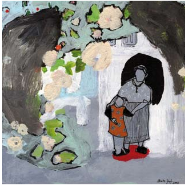
IM KRIEG II | 2008