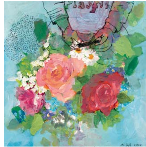
PLAYFUL IV | 2007