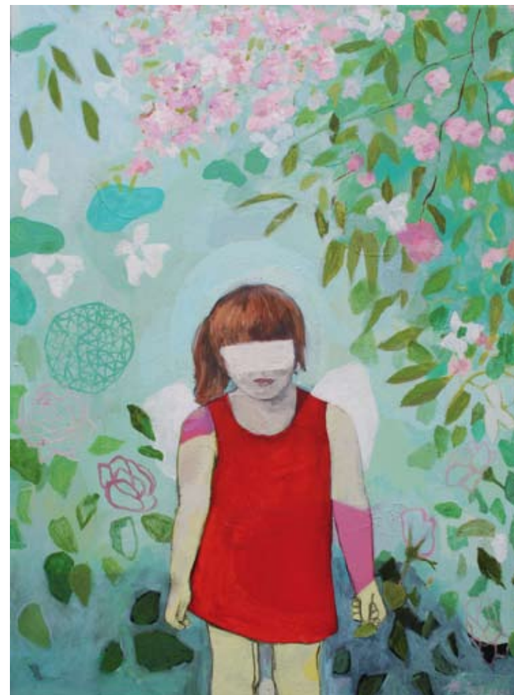
MÄDCHEN (MIT KIRSCHBLÜTEN) | 2009 | Acryl und Kohle auf Leinwand | 80 x 60 cm acrylic and charcoal on canvas | 31.5 x 23.6 in