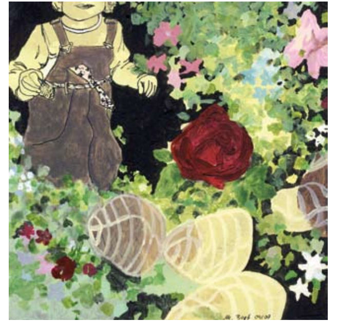
EMMA | 2007