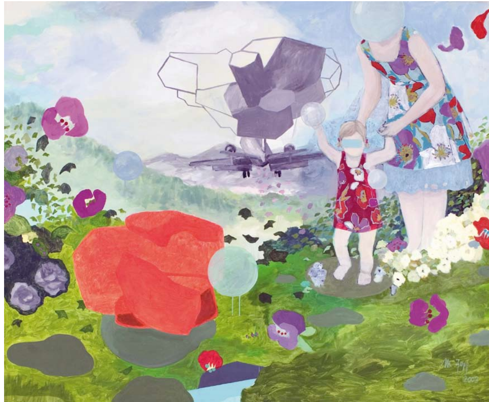
IDYLLE VI | 2009 | Acryl und Kohle auf Leinwand | 160 x 190 cm acrylic and charcoal on canvas | 63 x 74.8 in