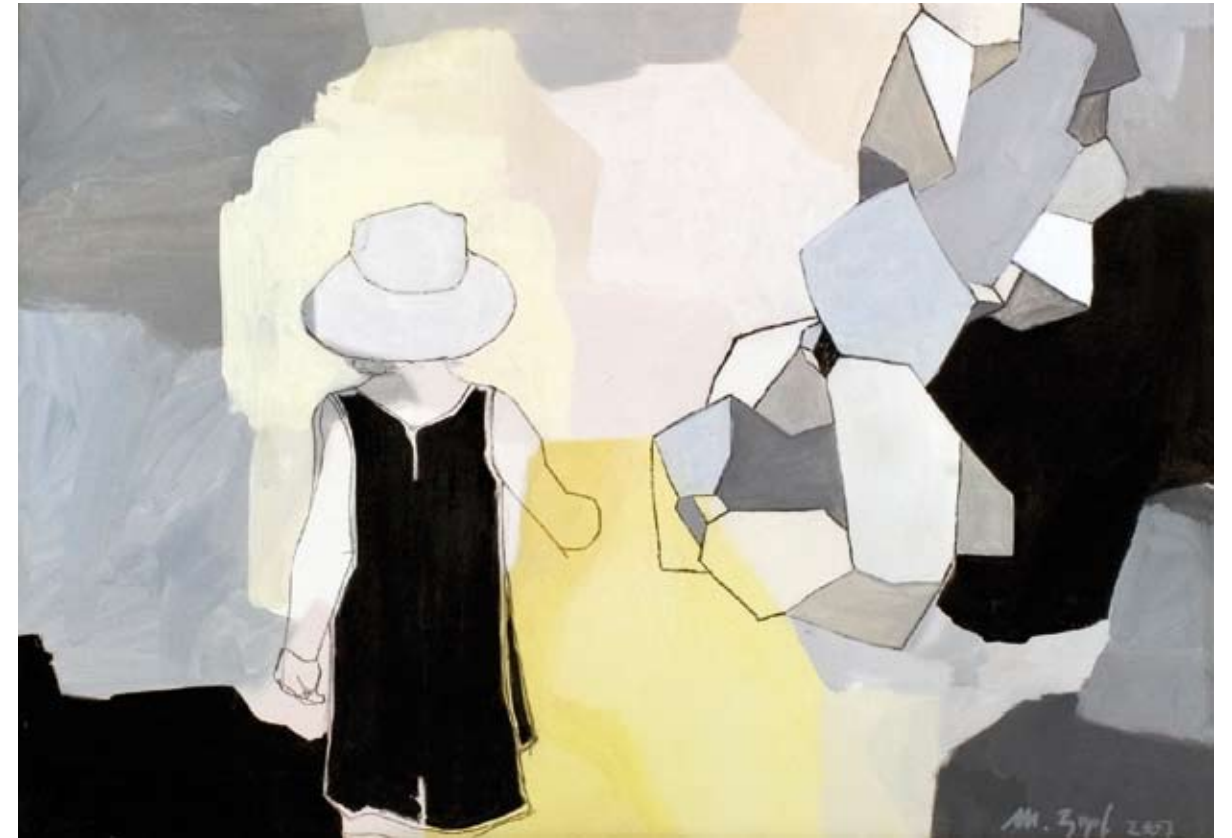
MÄDCHEN (MIT HUT) | 2007 | Acryl und Kohle auf Leinwand | 70 x 100 cm acrylic and charcoal on canvas | 27.6 x 39.4 in