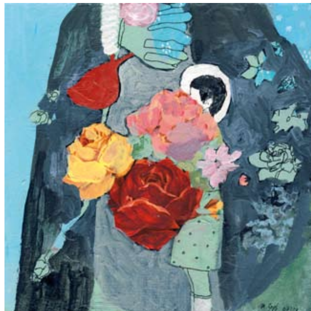
HANNAHS ANKUNFT | 2008