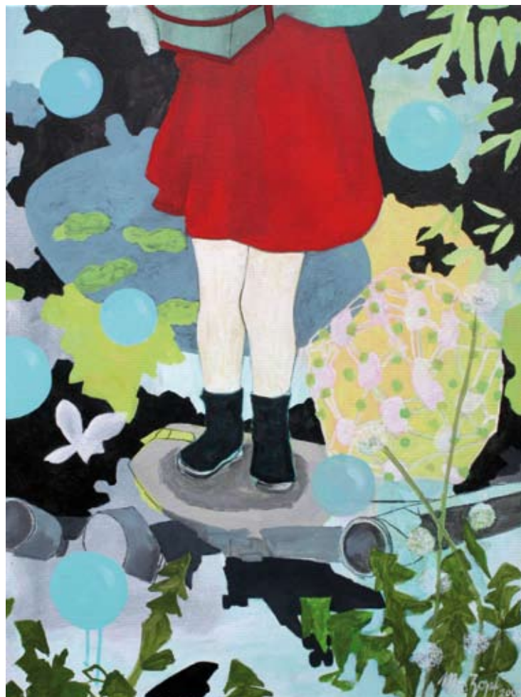
MÄDCHEN (VOM FLIEGEN) | 2009 | Acryl und Kohle auf Leinwand | 80 x 60 cm acrylic and charcoal on canvas | 31.5 x 23.6 in