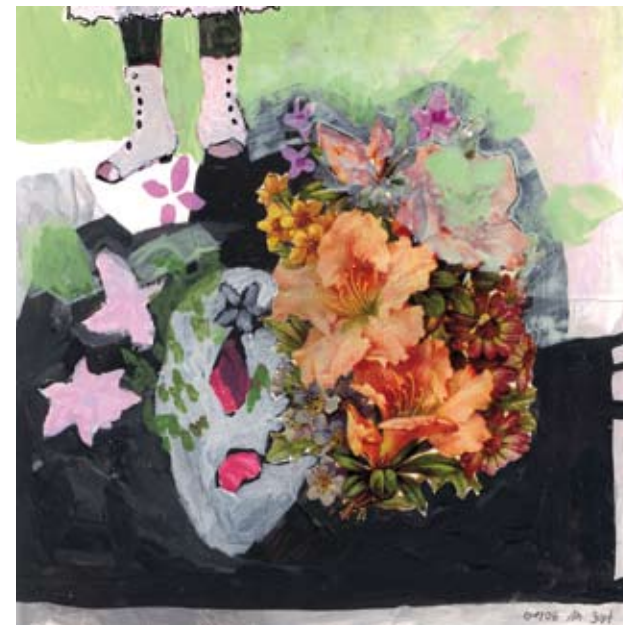
MÄDCHEN | 2006