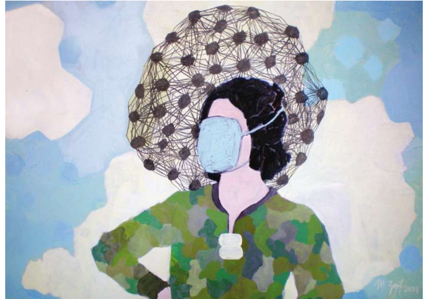
FRAU (IM KRIEG) | 2008 | Acryl und Kohle auf Leinwand | 80 x 110 cm acrylic and charcoal on canvas | 31.5 x 43.3 in