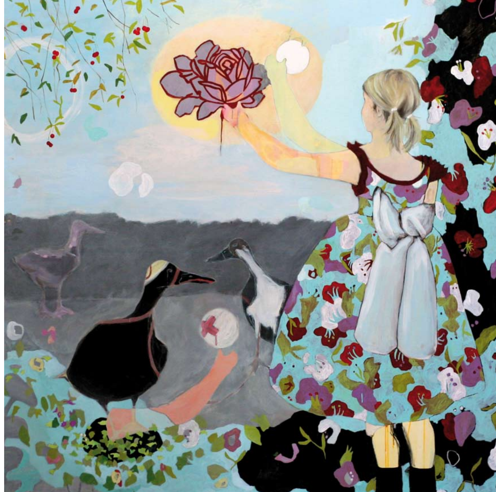
STILL RUHT DER SEE | 2008 | Acryl und Kohle auf Leinwand | 200 x 200 cm acrylic and charcoal on canvas | 78.7 x 78.7 in