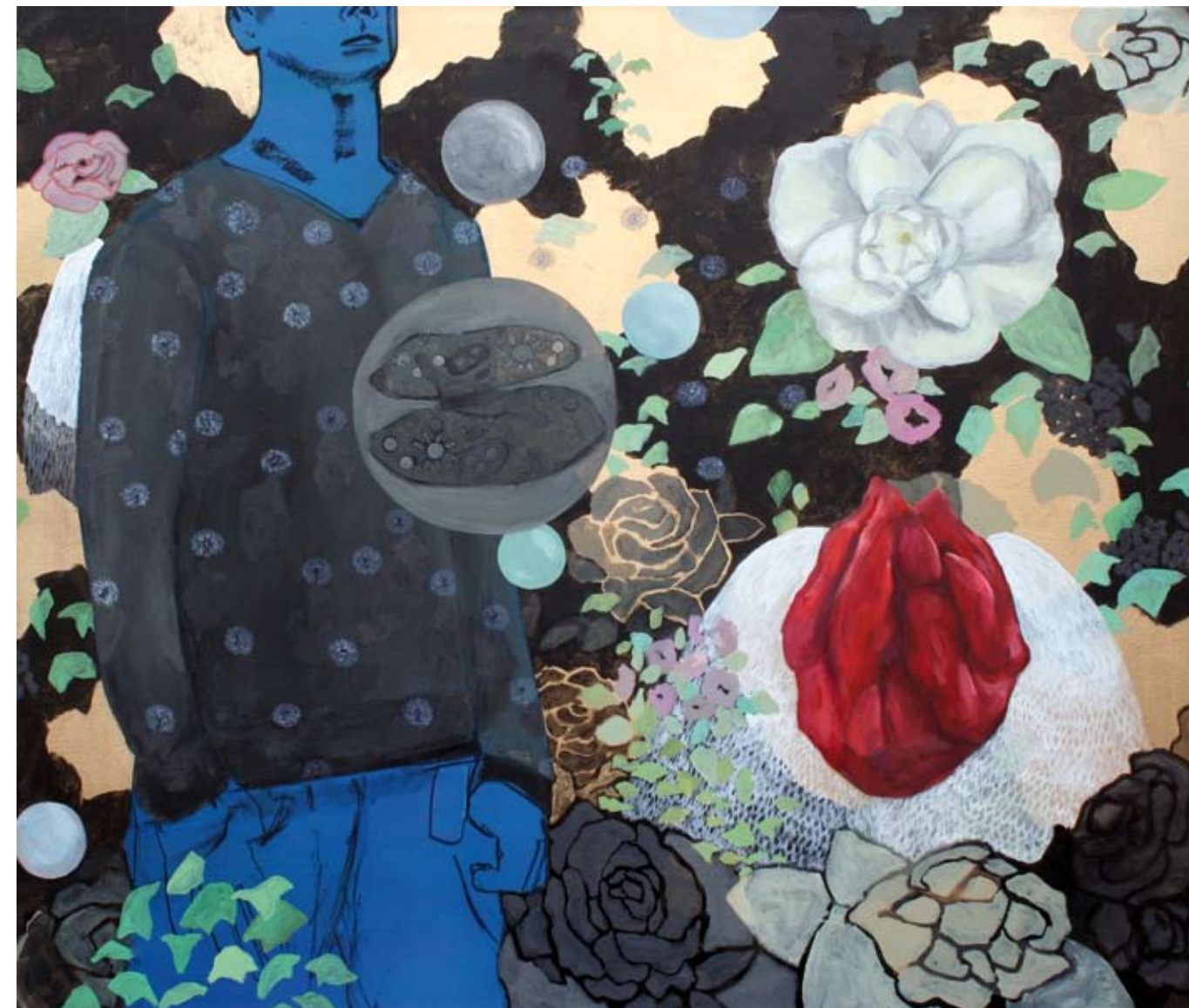
MANN (MIT PANTOFFELTIERCHEN) | 2009 | Acryl und Kohle auf Leinwand | 110 x 130 cm acrylic and charcoal on canvas | 43.3 x 51.2 in