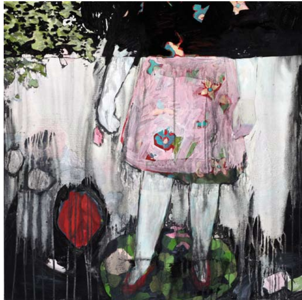
HERZ (VERLOREN) | 2009 | Acryl und Kohle auf Leinwand | 80 x 80 cm acrylic and charcoal on canvas | 31.5 x 31.5 in