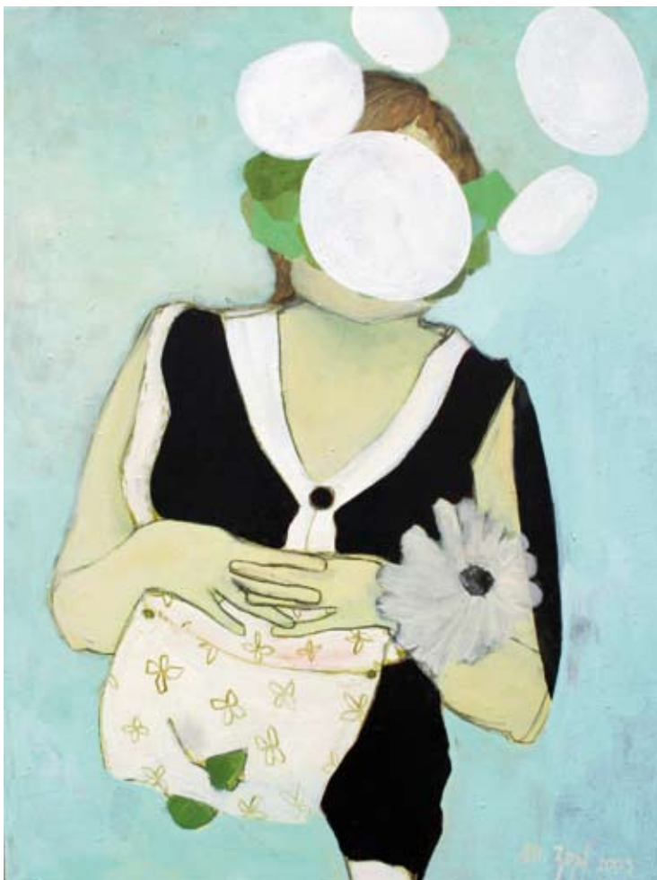
FRAU (MIT TASCHE) | 2009 | Acryl und Kohle auf Leinwand | 80 x 60 cm acrylic and charcoal on canvas | 31.5 x 23.6 in