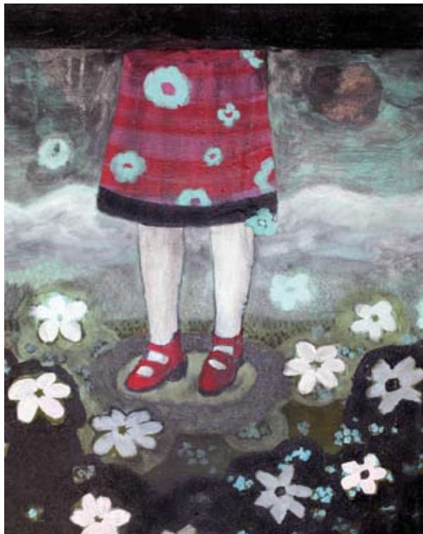
MÄDCHEN (MIT BLUMEN UND BERGEN) | 2008 | Acryl und Kohle auf Leinwand | 50 x 40 cm acrylic and charcoal on canvas | 19.7 x 15.8 in